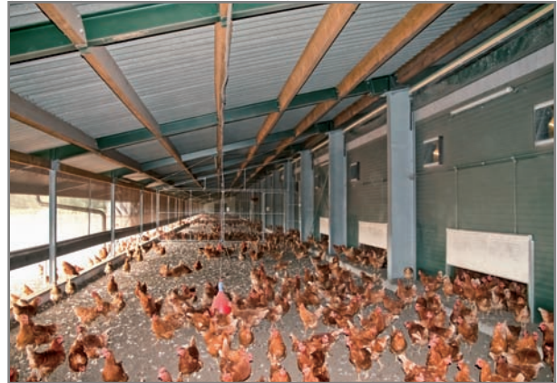
Wintergarten für Legehennen; Verdunklungsrollo halb geöffnet