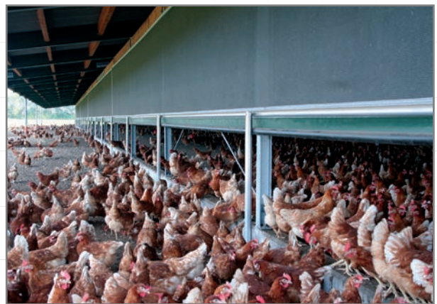
Auslaufrollo am Wintergarten – Außenansicht