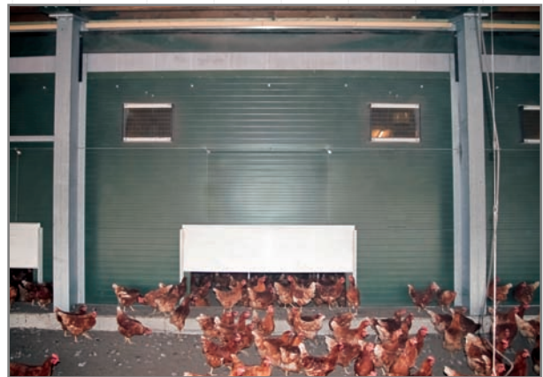
Teilsegment eines Verdunklungsrollos zwischen zwei Stützen; oben aufgewickelt