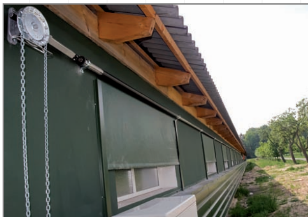
Verdunklungsrollo an der Außenwand; hier Handbetrieb