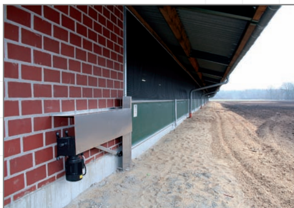
Antriebseinheit des Auslaufrollos; am Senkrechtwindkasten mit Bürste