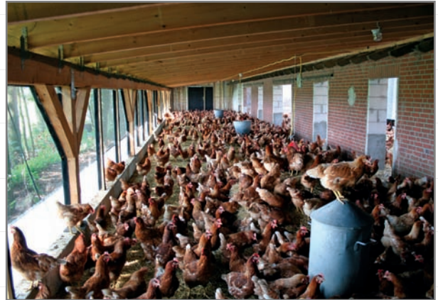
Wintergarten für Legehennen – Innenansicht