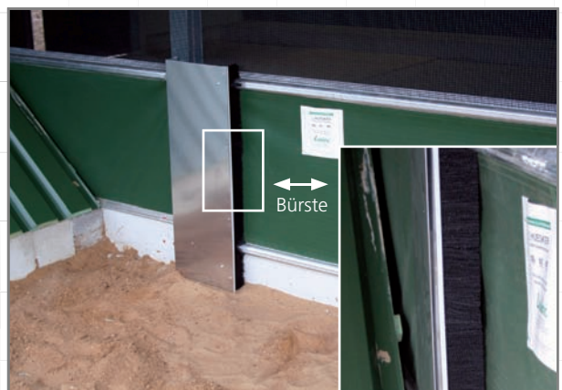
Windkasten mit Bürste für dichten Abschluss am Ende des Auslaufrollos an der Nichtantriebsseite